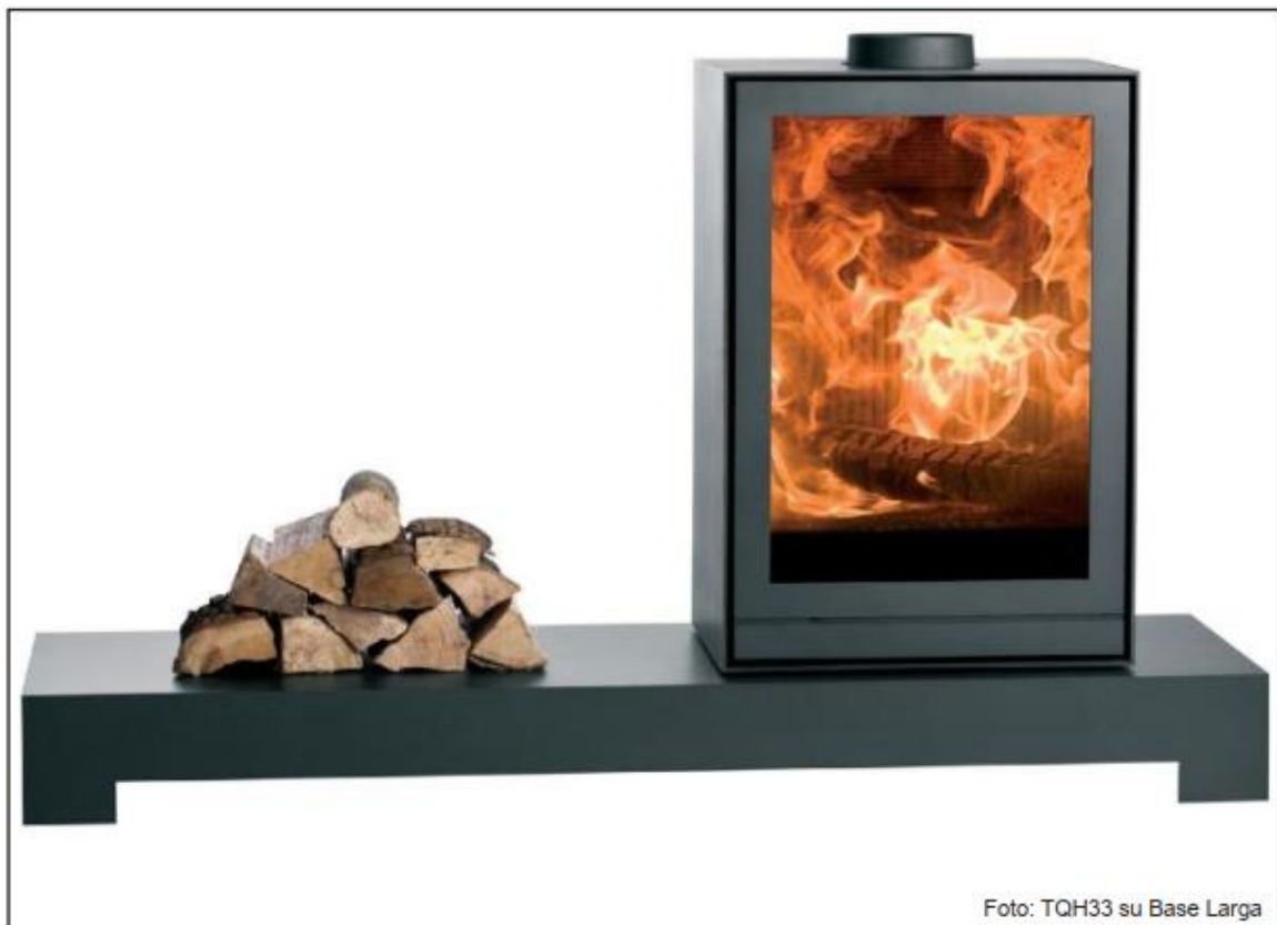
Foto: TQH33 su Base Larga

DOCUMENTACIÓN DE ESPECIFICACIONES TÉCNICAS DOCUMENTAZIONE DELLE SPECIFICHE TECNICHE TECHNICAL SPECIFICATION DOCUMENTATION DOCUMENTATION DE SPECIFICATION TECHNIQUES DOCUMENTAÇÃO DE ESPECIFICAÇÃO TÉCNICAS